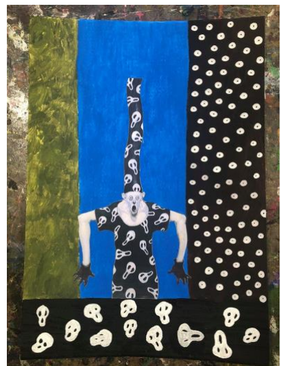
De færdige billeder. Detaljerne og farvevalget er tydeligt inspireret af personen, der er valgt.