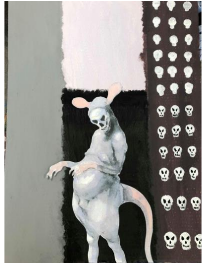
Billeder fra arbejdsfasen.