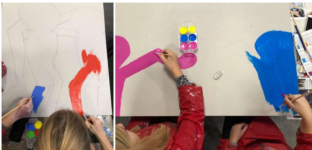
Der arbejdes sammen i makkerpar om ét billede. Mennesker og streger er skitseret op med blyant.