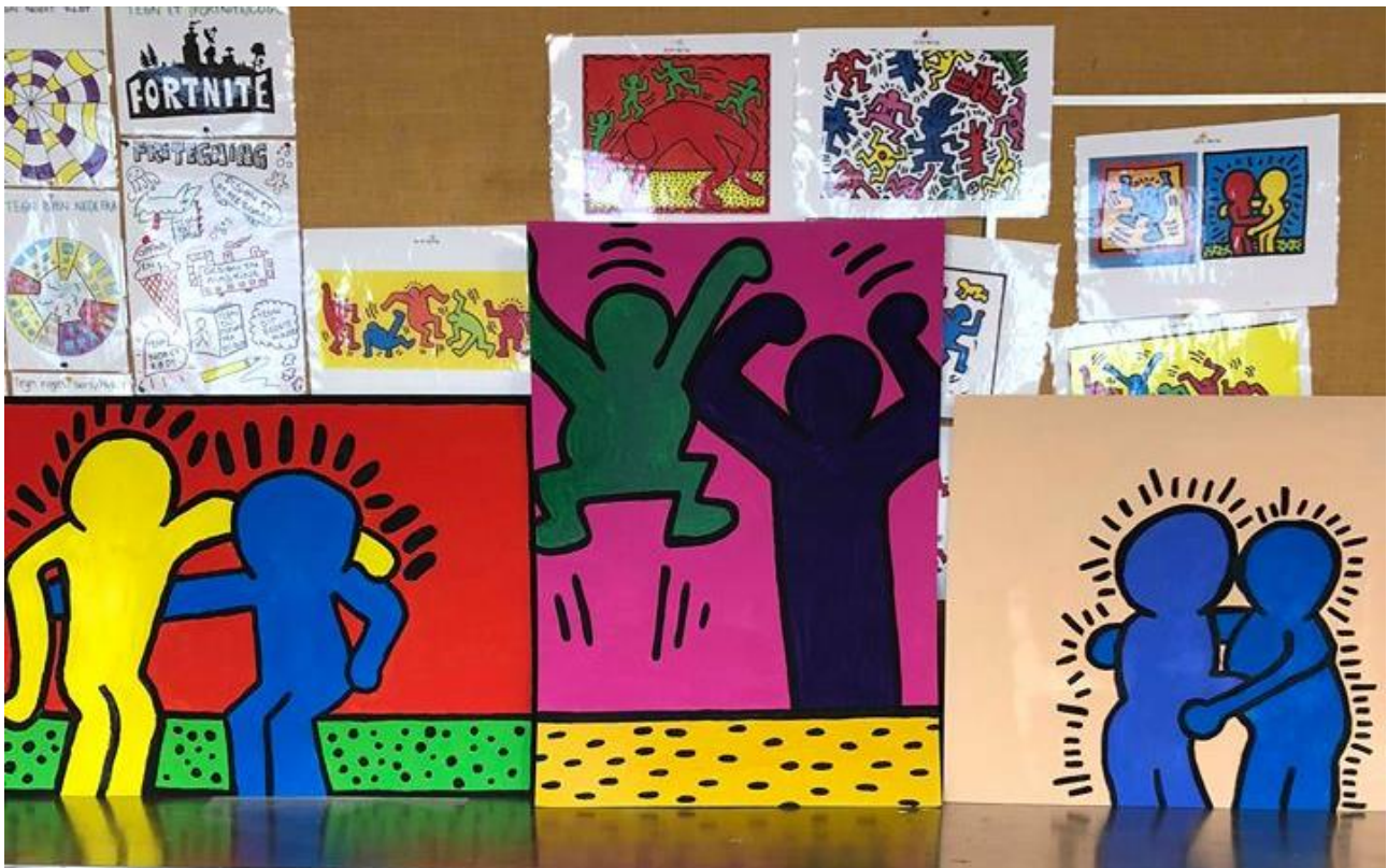
Udprintede Keith Haring billeder er hængt op i lokalet som inspiration til arbejdet og motiverne. Tre færdige billeder står klar til ophængning.