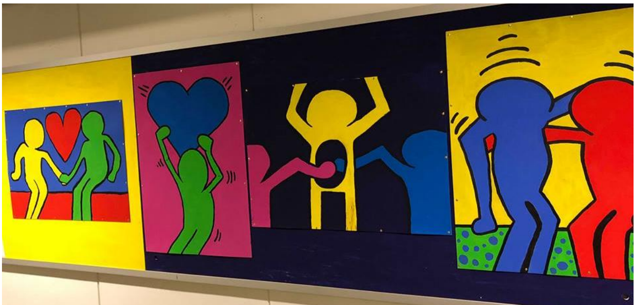
De færdige billeder er monteret på spånplader og hængt op som udsmykning på "billedkunstgangen".