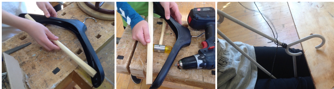
Bøjlerne kan blive re-designet og få et nyt liv på mange forskellige måder. Det er kun fantasien, der sætter grænser. Der benyttes forskellige teknikker.